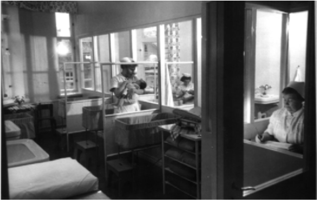
Kuva 3. Joulumerkkikodin arkea. Yövuoro tunnistamattomassa joulumerkkikodissa.

istuttiin takapihan nurmikolla huopien päällä. Vuorovaikutukseen vauvojan kanssa ei jäänyt aikaa eikä sen tärkeyttä siihen aikaan juurikaan tajuttu. Oleellista olivat puhtaus ja hyvä perushoito. [...] Vielä 1970-luvun alussa vauvoja hoidettiin ”maskien” (kasvosuojusten) kanssa, ja jos oli nuha, niin silloin oli kaksi maskia. Vauvalan sisustus oli vielä minun tullessani taloon 1970 hyvin steriili. 93 Diakonissalaitoksen lastenkodissa hoidettiin myös ekspositiovauvoja, eikä ole syytä olettaa, että sen hoitokulttuuri olisi olennaisesti poikennut joulumerkkikotien vastaavasta.